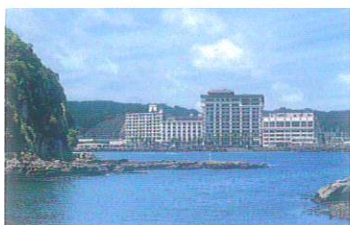
千葉県南房総 / 勝浦三日月温泉