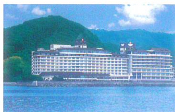
千葉県南房総 / 小湊鯛の浦温泉