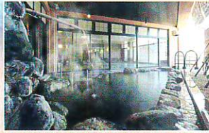
◆露天風呂（うたせ湯）

泉質：単純温泉（低張性・弱アルカリ性・高温泉） 効能：神経痛・筋肉痛・うちみ・慢性消化器病 痔疾・冷え性疲労回復・健康増進